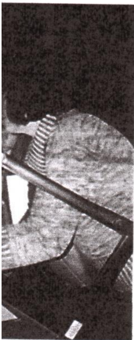
ка" за събиране на подписи дкрепата на половината свое

Партии ще се окажат в още по-голям натиск на мафиоти и генерали